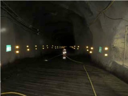
Rampenabstieg, Blick abwärts

MAG Silver führt die bisherigen großartigen Arbeiten fort und entwickelt Juanicipio in die Produktion mit geplantem Abbaustart in 2018. Fertigstellung Rampenzugang Q1-2017.