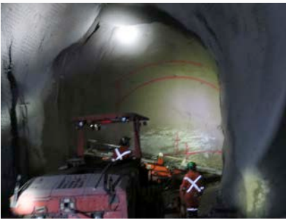
Explorationsbohrung MAG Silbermine