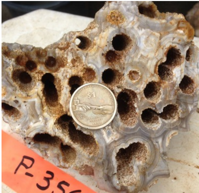
Abbildung 3. Konzentrische chalzedonische Schichtung um rohrförmige Hohlräume, die als Abgüsse von Schilfrohrstämmen aus der Sinterzone bei Yawi interpretiert werden. Die Münze hat einen Durchmesser von 2,6 Zentimetern (1 Zoll).