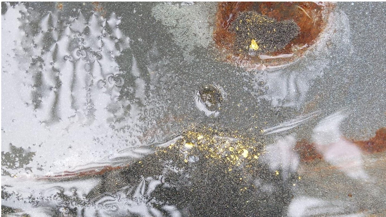
Abbildung 2: Goldrückgewinnung nach 2-stündigem Waschtest.

Weitere Neuigkeiten sind, dass ein Anaconda-Kartierungsprogramm im südlichen Teil von Aurantias Porphyry-Kupfer-Zielgebiet Awacha abgeschlossen wurde und die Explorationsteams weiterhin das restliche Gebiet kartieren. Eine geophysikalische Untersuchung mit induzierter Polarisation ist für das epithermale Goldziel Kuri-Yawi geplant.