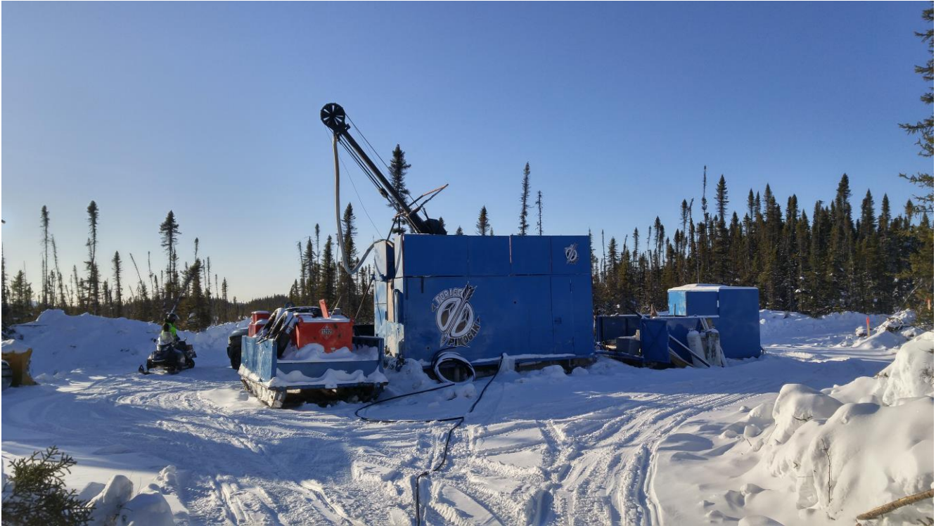
Obige Abbildung: Zweites Bohrgerät untersucht nun Stepout-Zielgebiete bei Douay